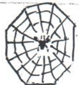
une toile d'araignée