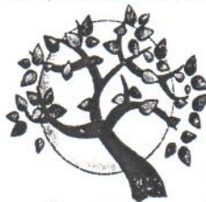
la lune entière