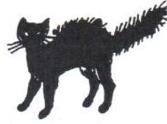
un chat noir