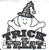
farce ou friandise