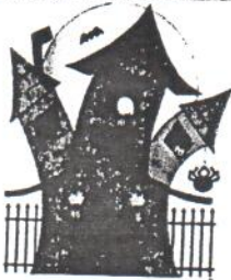
une maison hantée