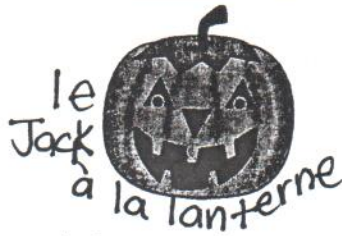
le Jack à la lanterne