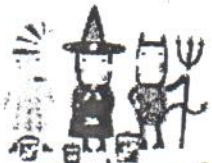
un costume d'Halloween