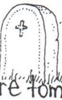
une pierre tombale